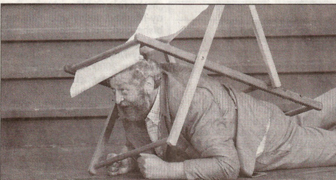
Junker Tobias (Bert Franzke) kämpft mit dem Liegestuhl.

Die fast dreistündige Vorstellung war den Zuschauern Standung ovations wert.